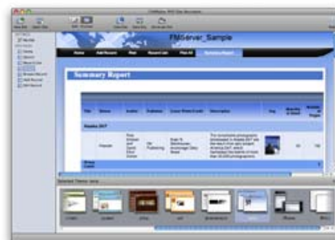
Erstellen Sie mit dem PHP-Site-Assistenten in wenigen Minuten beeindruckende Websites.

Mit den ausgefeilten Sicherheitsfunktionen von FileMaker Server 10 schützen Sie Ihre Daten jetzt noch besser. Dafür sorgen die Verwendung des Secure Socket Layer (SSL)-Protokolls und der verschlüsselte Datenaustausch zwischen dem Server, der eine Datenbank bereitstellt, und den Arbeitsplatzrechnern. Steuern Sie den Zugriff auf zentral gehostete Datenbanken mit einem Filter, der die Berechtigungen der Anwender berücksichtigt. Benutzerkonten und Passwörter verwalten Sie effizient mit einer externen Active Directory- und Open Directory-Authentifizierung.